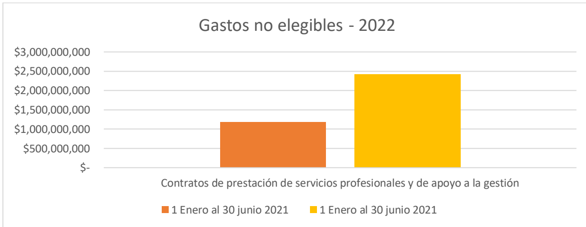
Tabla 2. Seguimiento de rubro y meta de Austeridad del Gasto Público – Gastos no elegibles

Estos rubros no se tuvieron en cuenta, debido al que número de personas contratadas es algo que depende desde del despacho de la Alcaldía Local y de las necesidades que presente el territorio, ya que son dinámicas y cambiantes. Es importante resaltar que muchos de los contratos de prestación de servicios son generados mediante proyectos de inversión local, en el cumplimiento de las metas del Plan de Desarrollo Local.