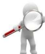
Tipos de Solicitudes